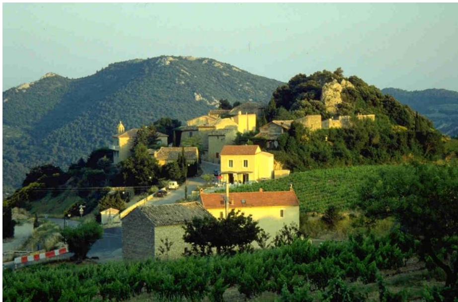
Foto: Abendstimmung in Suzette – in dem sonnenbeschieneenen Haus in der Mitte des Bildes ist ein nettes Restaurant mit aussichtsreicher Terrasse.